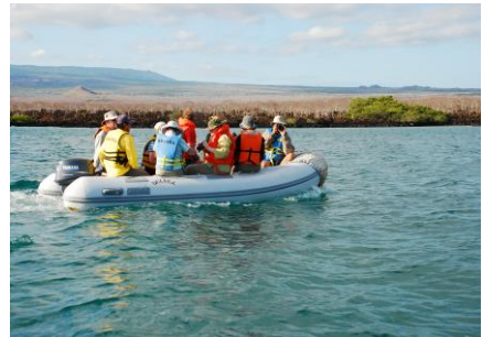
Transport till land